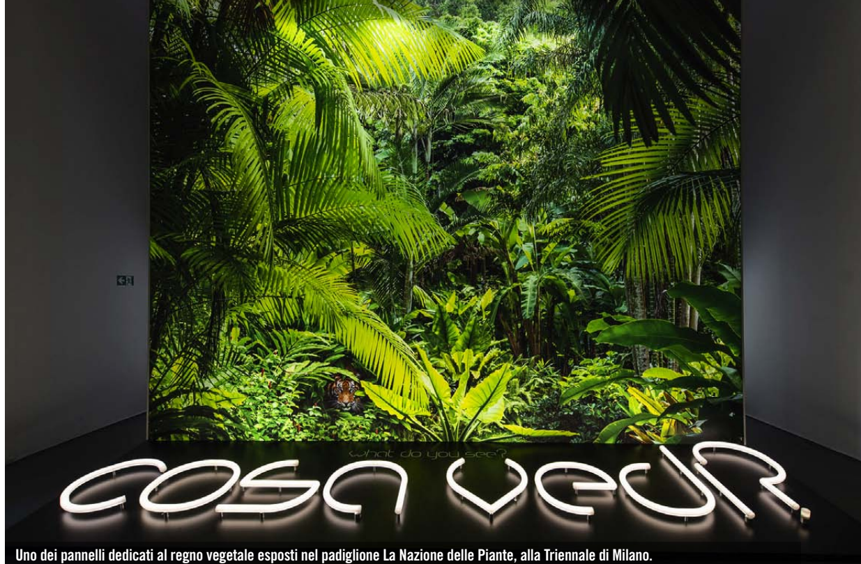
Uno dei pannelli dedicati al regno vegetale esposti nel padiglione La Nazione delle Piante, alla Triennale di Milano.

Il padiglione ceco riflette sullo spreco di energia con questa installazione composta da batterie usate.